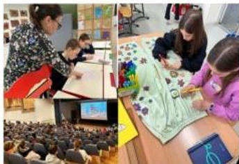
Laboratorul de idei, Nr. 27/2024